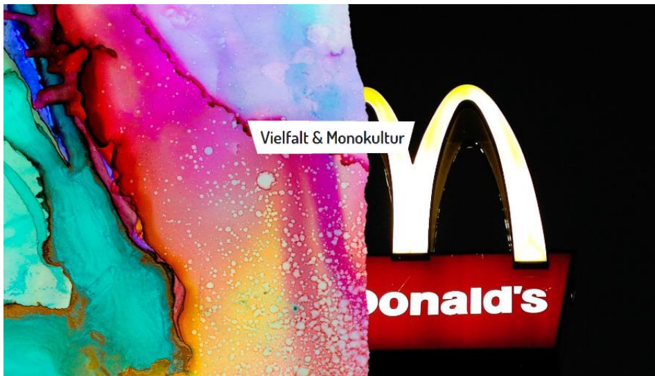
Bild 2: Links: Unterschiedliche Farben, die Vielfalt darstellen sollen. Rechts: McDonald's Zeichen. Der Schriftzug „Vielfalt und Monokultur“ steht in der Mitte.