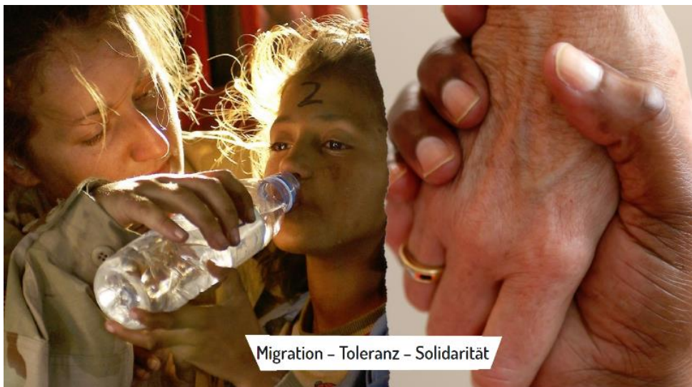
Bild 5: Migration, Toleranz, Solidarität steht als Schriftzug auf dem Bild. Links ist ein weinendes Mädchen zu sehen, das von einer Fluchthelfer:in beim Trinken aus einer Wasserflasche unterstützt wird. Rechts sind zwei sich umschließende Hände zu sehen. Eine Hand ist von einer BPOC (=Schwarzen Person), die andere ist von einer weißen Person.