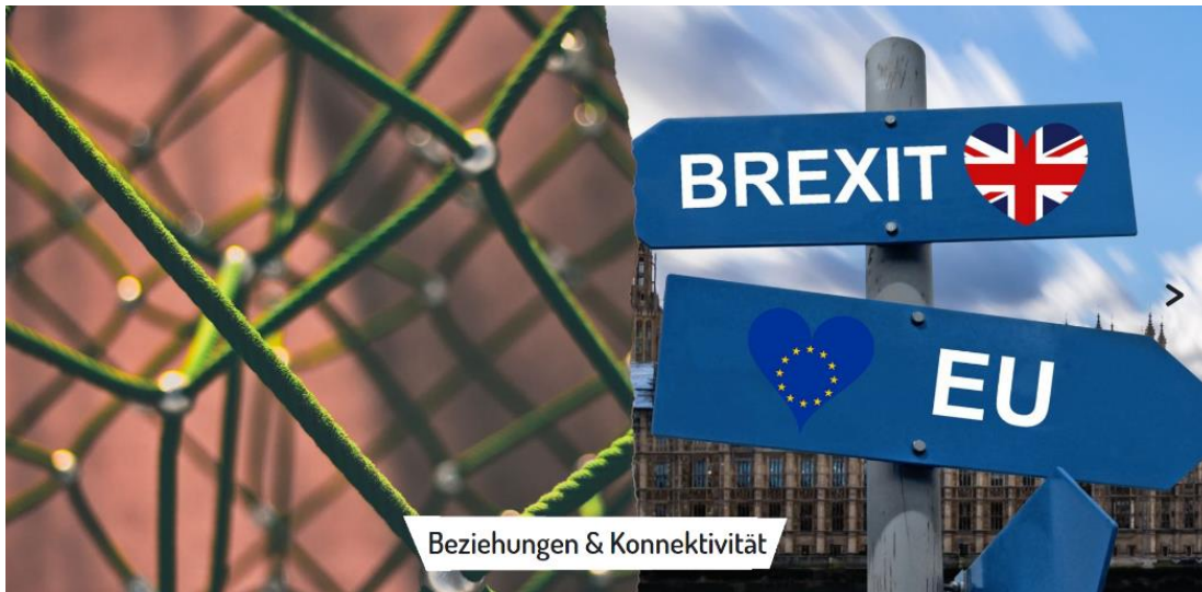
Bild 6: "Beziehung und Konnektivität (=Vernetzung)" steht als Schriftzug unten im Bild. Links ist ein Netz zu sehen. Rechts ist ein Wegweiser zu sehen. Auf einem Pfeil in eine Richtung steht "Brexit": Auf einem Pfeil in die andere Richtung steht "EU".