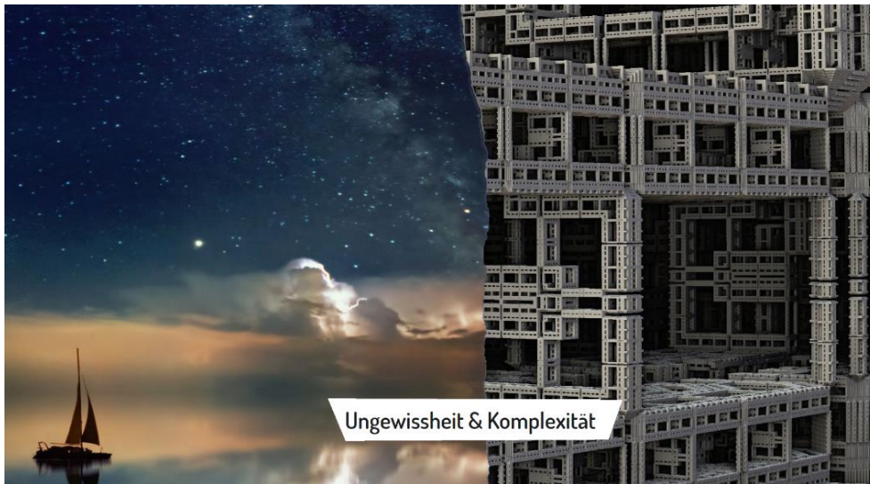
Bild 8: "Ungewissheit und Komplexität" steht auf dem Schriftzug. Links ist ein Segelboot zu sehen, das auf dem Wasser unter einem Sternenhimmel fährt. Rechts ist ein Gerüst zu sehen, das kompliziert zusammengesetzt ist.