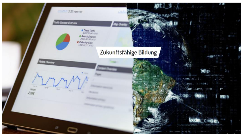
Bild 10: "Zukunftsfähige Bildung" steht auf einem Schriftzug auf dem Bild. Links ist der Bildschirm eines Tablets zu sehen. Rechts ist eine Weltkugel zu sehen. Ein digitaler Bildschirm überzieht die Weltkugel und stellt die digitalisierte Welt dar.