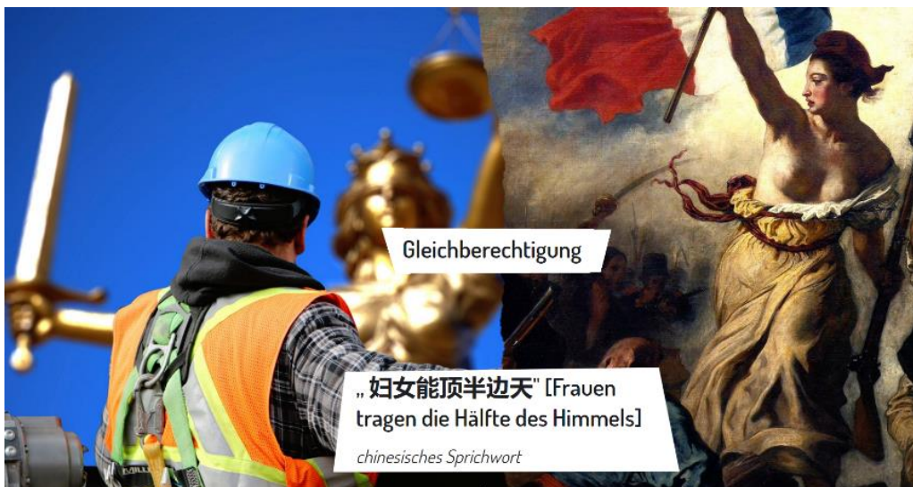
Bild 1: Thema des Bildes ist Gleichberechtigung. Darunter steht ein chinesisches Sprichwort: „Frauen tragen die Hälfte des Himmels.“