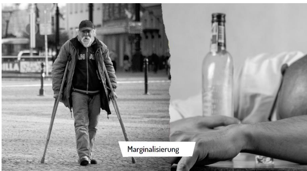
Bild 3: Marginalisierung steht als Schriftzug in der Mitte des Bildes. Links ist ein alter Mann auf Krücken zu sehen, der auf einer Straße läuft. Rechts ist ein Mann zu sehen, der seinen Kopf auf dem Tisch ablegt. Seine Hand umschließt eine Alkoholflasche.