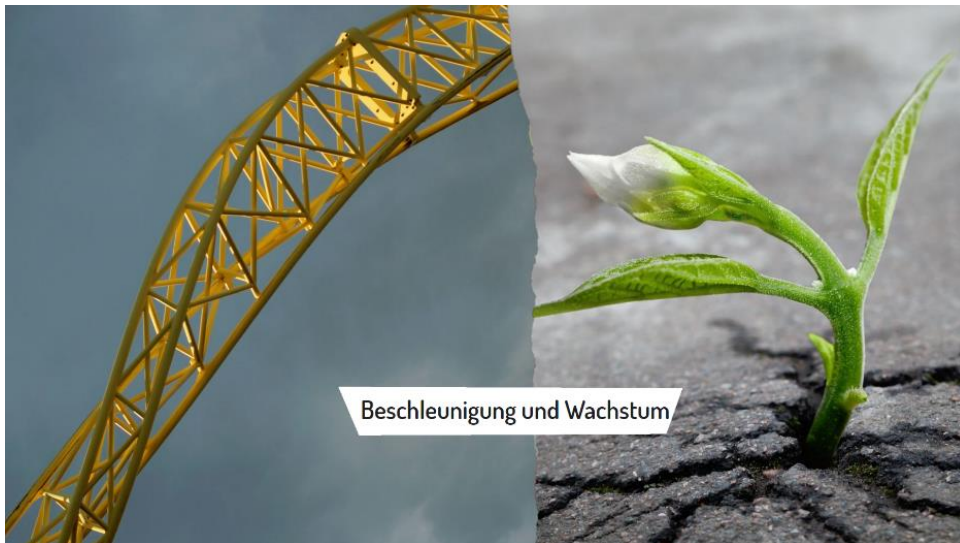
Bild 4: Beschleunigung und Wachstum steht als Schriftzug in der Mitte des Bildes. Links sind Gleise einer Achterbahn zu sehen. Rechts ist eine Blume zu sehen, die aus einem Betonboden heraus blüht.