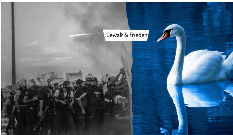
Bild 7: "Gewalt und Frieden" steht auf dem Schriftzug. Links sind bewaffnete Polizist:innen zu sehen. Es steigt Rauch auf. Auf der rechten Seite ist ein weißer Schwan zu sehen, der im Wasser schwimmt.