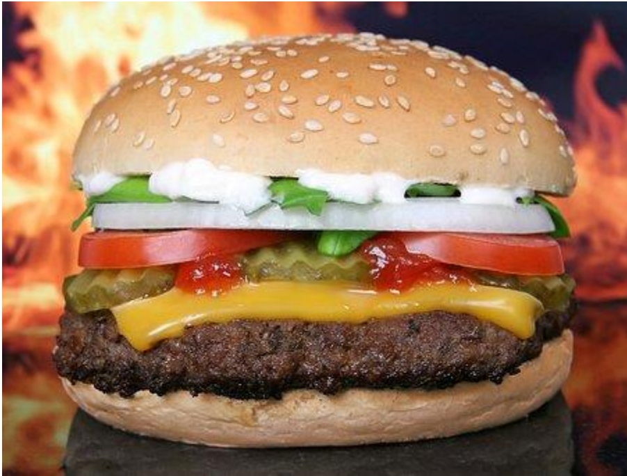
B1: Bild eines Hamburgers