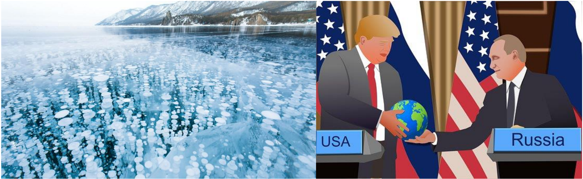
B1: See mit gefrorenem Methan in Sibirien