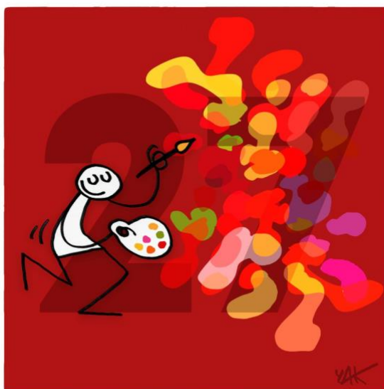
Abbildung 27: Das Bild zu Artikel 27.

Jeder Mensch hat das Recht, am kulturellen Leben der Gemeinschaft frei teilzunehmen, sich der Künste zu erfreuen und am wissenschaftlichen Fortschritt und dessen Wohltaten teilzuhaben. [...]