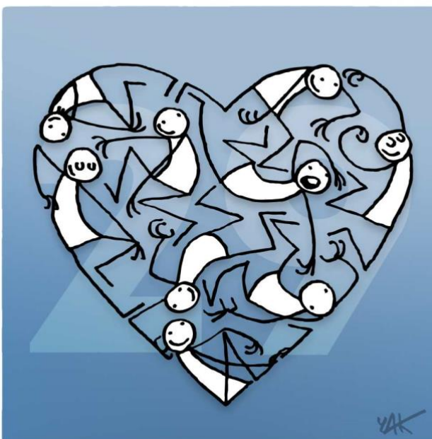
Abbildung 29: Das Bild zu Artikel 29.

Jeder Mensch hat Pflichten gegenüber der Gemeinschaft [...]