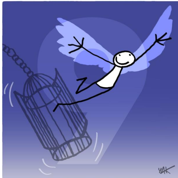
Abbildung 9: Das Bild zu Artikel 9.

Niemand darf willkürlich festgenommen, in Haft gehalten oder ausgewiesen werden.