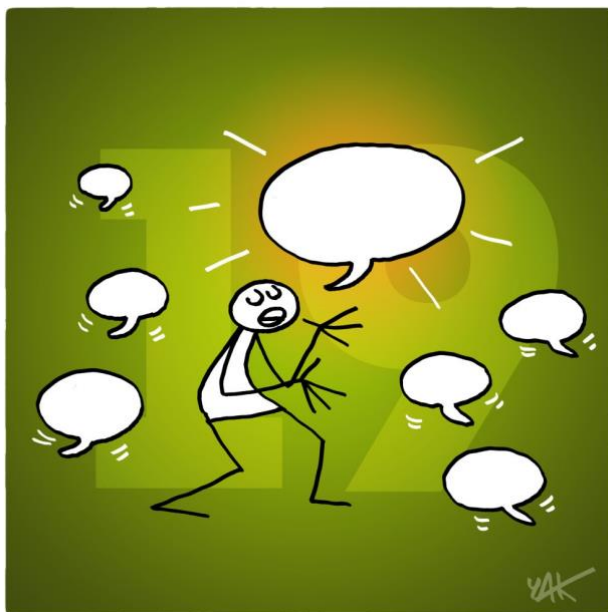
Abbildung 19: Das Bild zu Artikel 19.

Jeder Mensch hat das Recht auf freie Meinungsäußerung; dieses Recht umfasst die Freiheit, Meinungen zu unterstützen und Informationen und Ideen zu suchen, zu empfangen und zu verbreiten.