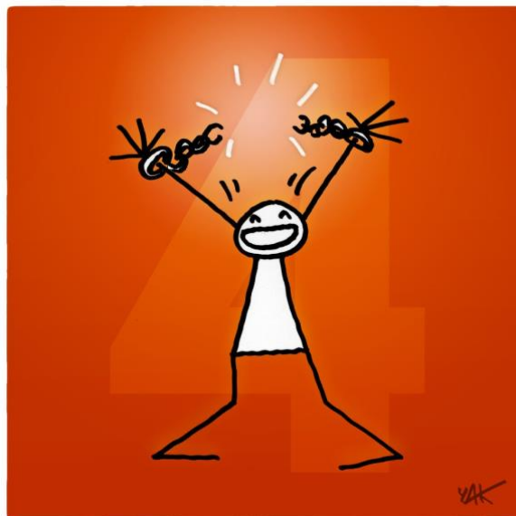
Abbildung 4: Das Bild zu Artikel 4.

Niemand darf als Sklave oder Diener gehalten werden; die Sklaverei ist in all ihrer Form verboten.