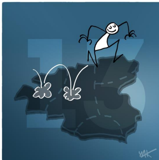
Abbildung 13: Das Bild zu Artikel 13.

Jeder Mensch hat das Recht auf Freizügigkeit und freie Wahl seines Wohnsitzes innerhalb eines Staates. Jeder Mensch hat das Recht, jedes Land, einschließlich seines eigenen, zu verlassen sowie in sein Land zurückzukehren.