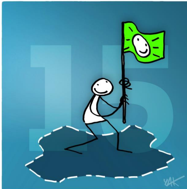
Abbildung 15: Das Bild zu Artikel 15.

Jeder Mensch hat Anspruch auf eine Staatsangehörigkeit.