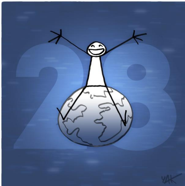
Abbildung 28: Das Bild zu Artikel 28.

Jeder Mensch hat Anspruch auf eine soziale und internationale Ordnung, in welcher die in der vorliegenden Erklärung angeführten Rechte und Freiheiten voll verwirklicht werden können.