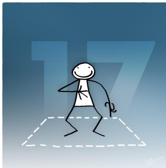
Abbildung 17: Das Bild zu Artikel 17.

Jeder Mensch hat allein oder in der Gemeinschaft mit anderen Recht auf Eigentum. Niemand darf willkürlich seines Eigentums beraubt werden.