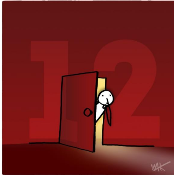
Abbildung 12: Das Bild zu Artikel 12.

Niemand darf willkürlichen Eingriffen in sein Privatleben, seine Familie, sein Heim oder seinen Briefwechsel noch Angriffen auf seine Ehre und seinen Beruf ausgesetzt werden. [...]