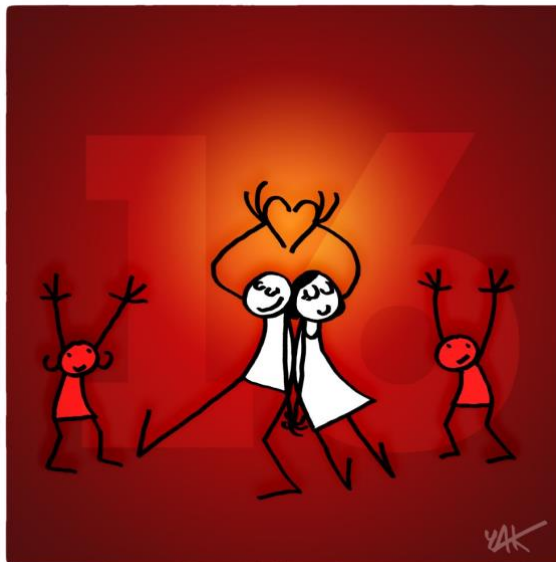
Abbildung 16: Das Bild zu Artikel 16.

Männer und Frauen haben ohne Beschränkung das Recht, eine Ehe zu schließen und eine Familie zu gründen. Sie haben bei der Eheschließung, während der Ehe und bei deren Auflösung gleiche Rechte. Die Ehe darf geschlossen werden, wenn freiwillig zugestimmt wird. Die Familie hat Anspruch auf Schutz durch Gesellschaft und Staat.