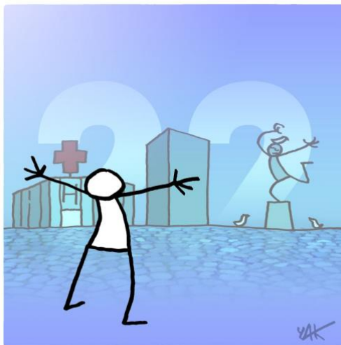
Abbildung 22: Das Bild zu Artikel 22.

Jeder Mensch hat [...] das Recht auf soziale Sicherheit; er hat Anspruch auf wirtschaftliche, soziale und kulturelle Rechte, die für seine Würde und die freie Entwicklung seiner Persönlichkeit notwendig sind.