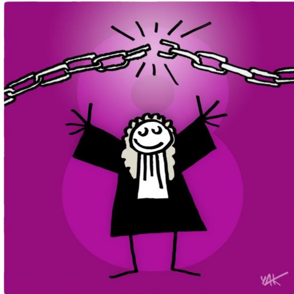
Abbildung 8: Das Bild zu Artikel 8.

Jede Person hat ein Recht auf einen wirksamen Rechtsschutz vor den zuständigen nationalen Gerichten für Verletzungen der Grundrechte.