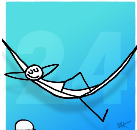
Abbildung 24: Das Bild zu Artikel 24.

Jeder Mensch hat Anspruch auf Erholung und Freizeit sowie auf eine vernünftige Begrenzung der Arbeitszeit und auf bezahlten Urlaub.