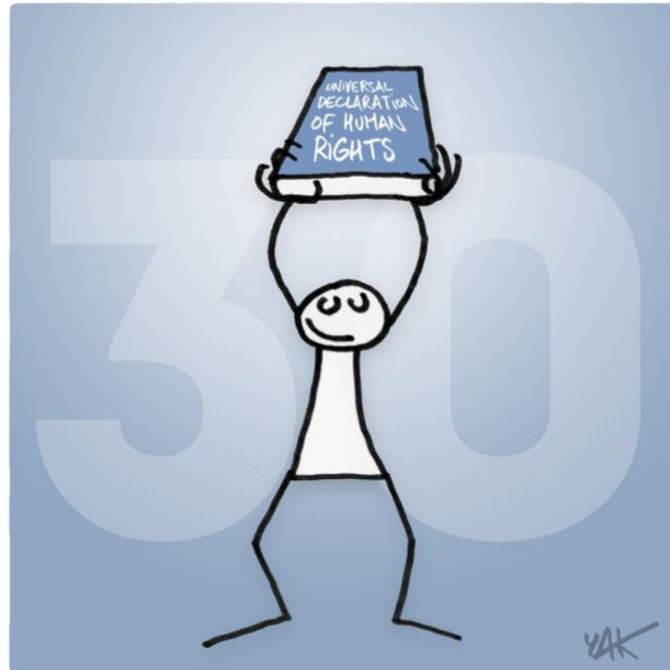
Abbildung 30: Das Bild zu Artikel 30.

Keine Bestimmung der vorliegenden Erklärung darf so ausgelegt werden, dass sich daraus [...] irgendein Recht ergibt, [...] eine Handlung vorzunehmen, welche auf die Vernichtung der in dieser Erklärung angeführten Rechte und Freiheiten abzielt.