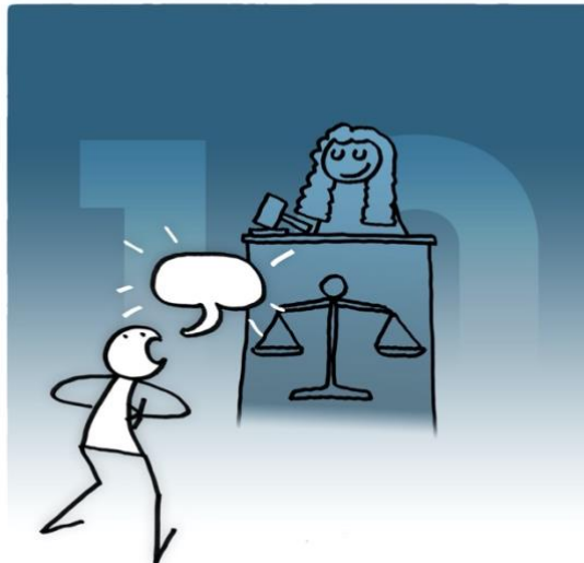
Abbildung 10: Das Bild zu Artikel 10.

Jede Person hat ein Recht, vor einem unabhängigen und unparteiischen Gericht öffentlich angehört zu werden.