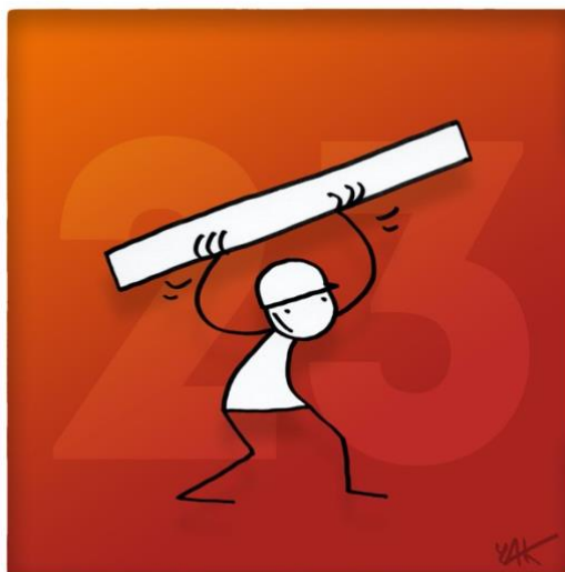
Abbildung 23: Das Bild zu Artikel 23.

Jeder Mensch hat das Recht auf Arbeit, auf freie Berufswahl, auf angemessene und befriedigende Arbeitsbedingungen sowie auf Schutz gegen Arbeitslosigkeit. Alle Menschen haben [...] das Recht auf gleichen Lohn für gleiche Arbeit. Jeder Mensch [...] hat das Recht auf angemessene und befriedigende Entlohnung, die ihm und seiner Familie eine der menschlichen Würde entsprechende Existenz sichert [...]