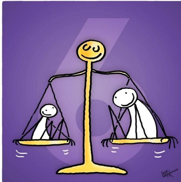
Abbildung 6: Das Bild zu Artikel 6.

Jeder Mensch hat überall das Recht auf die Anerkennung seiner Persönlichkeit,