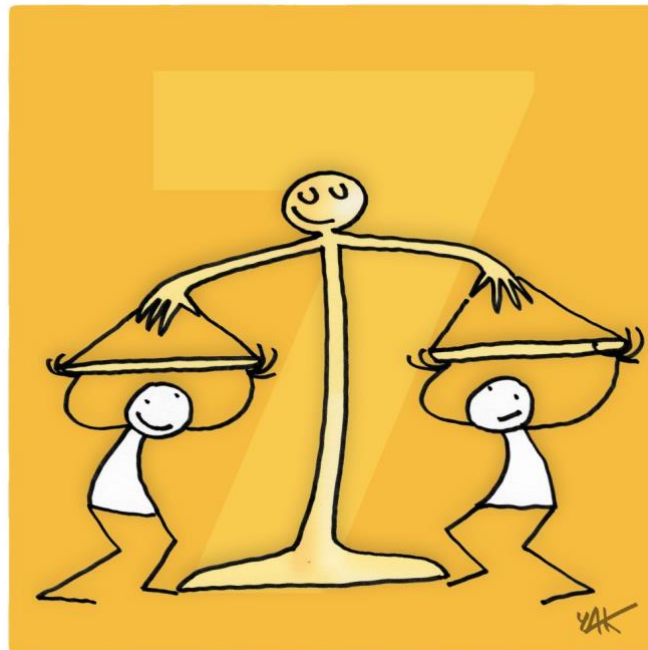
Abbildung 7: Das Bild zu Artikel 7.

Alle sind gleich vor dem Gesetz und haben das Recht auf den gleichen Schutz durch das Gesetz. [...]