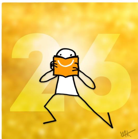
Abbildung 26: Das Bild zu Artikel 26.

Jeder Mensch hat Recht auf Bildung. Der Unterricht muss wenigstens in der Grundschule kostenlos sein. [...] Die Ausbildung soll auf die volle Entfaltung der menschlichen Persönlichkeit und die Stärkung der Achtung der Menschenrecht abzielen. [...]