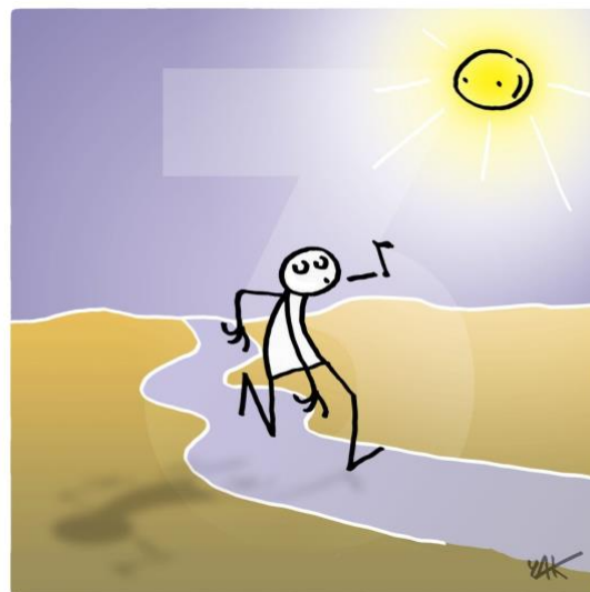
Abbildung 3: Das Bild zu Artikel 3.

Jedes Individuum hat ein Recht auf Leben, Freiheit und auf Sicherheit für seine Person.