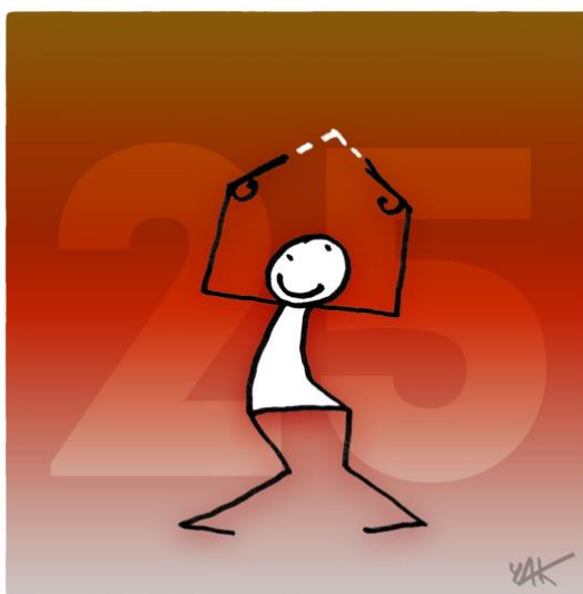
Abbildung 25: Das Bild zu Artikel 25.

Jeder Mensch hat Anspruch auf einen Lebensstandard, welcher Gesundheit und Wohlbefinden einschließlich Nahrung, Kleidung, Wohnung [und] ärztlicher Betreuung einschließt; er hat das Recht auf Sicherheit im Falle von Arbeitslosigkeit [oder] Krankheit. Mutter und Kind haben Anspruch auf besondere Hilfe und Unterstützung. [...]