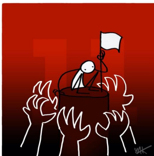
Abbildung 11: Das Bild zu Artikel 11.

Niemand darf verurteilt werden für Handlungen, die zum Zeitpunkt der Begehung der Handlung nicht strafbar waren. [...]