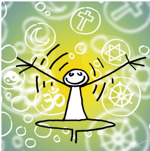
Abbildung 18: Das Bild zu Artikel 18.

Jeder Mensch hat Anspruch auf Gedanken-, Gewissens- und Religionsfreiheit [...].