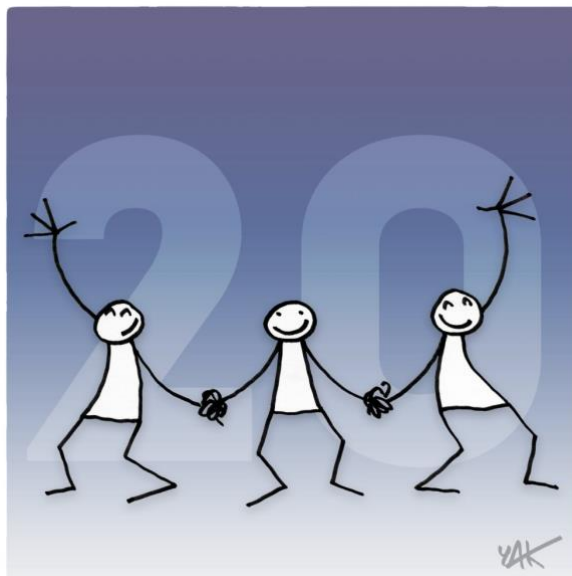
Abbildung 20: Das Bild zu Artikel 20.

Jeder Mensch hat das Recht auf Versammlungs- und Vereinigungsfreiheit zu friedlichen Zwecken. Niemand darf gezwungen werden, einer Vereinigung anzugehören.