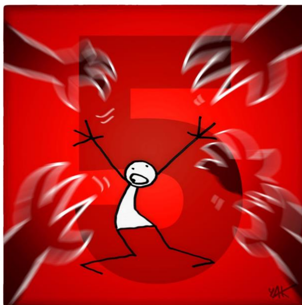
Abbildung 5: Das Bild zu Artikel 5.

Niemand darf gefoltert werden und niemand darf grausam, unmenschlich oder erniedrigend behandelt oder bestraft werden.