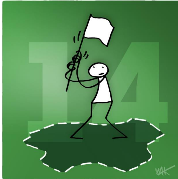
Abbildung 14: Das Bild zu Artikel 14.

Jeder Mensch hat das Recht, in anderen Ländern vor Verfolgungen Asyl zu suchen und zu genießen.