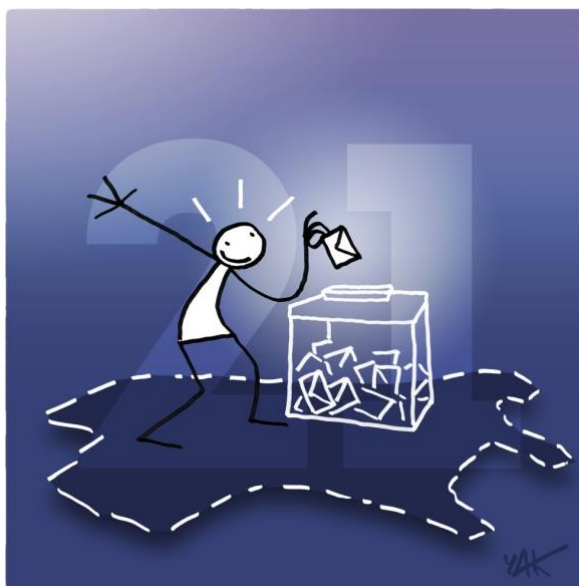
Abbildung 21: Das Bild zu Artikel 21.

Jeder Mensch hat das Recht, an der Leitung seines Landes unmittelbar oder durch frei gewählte Vertreter teilzunehmen. [...]