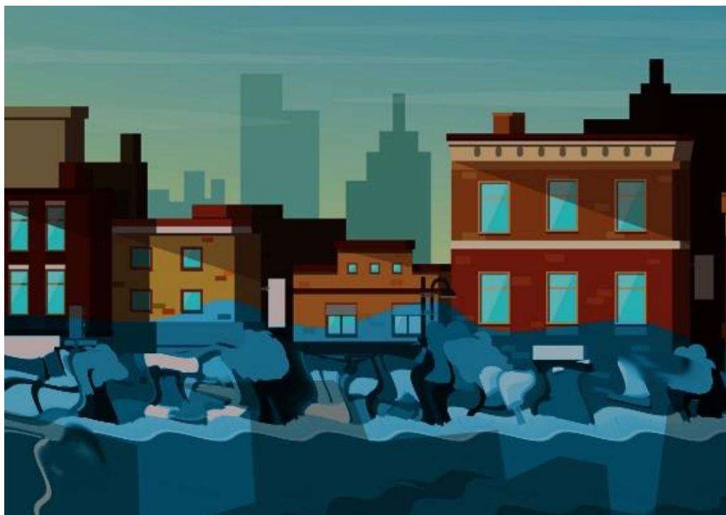
Abbildung 4: Eine überschwemmte Stadt.