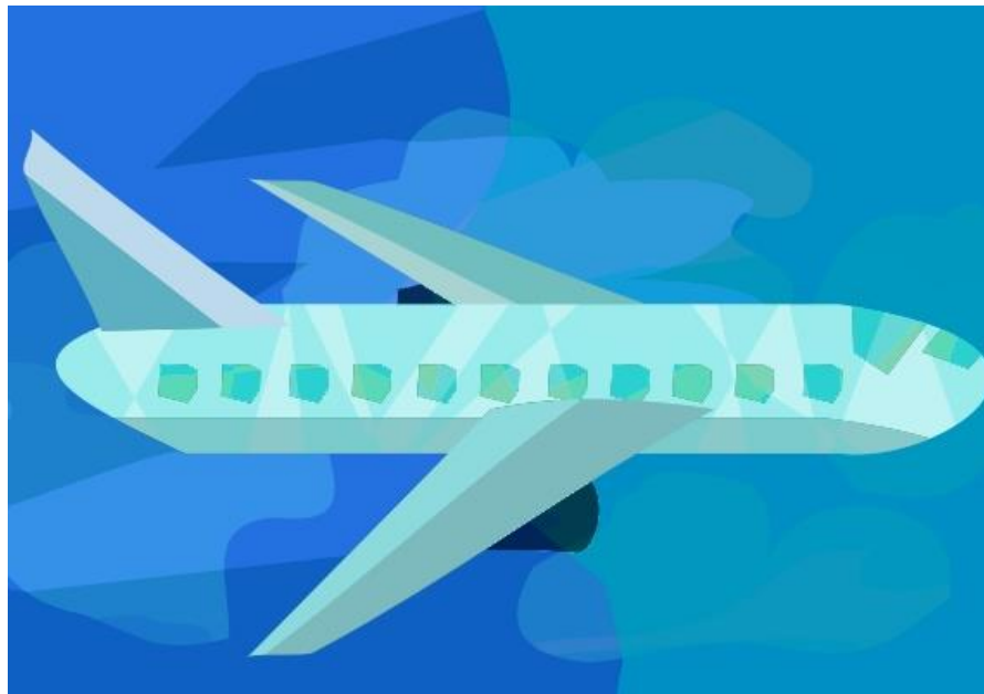
Abbildung 2: Ein Flugzeug während dem Fliegen.