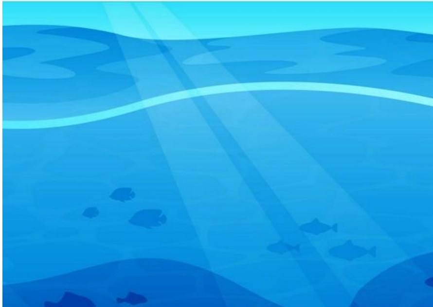
Abbildung 1: Eine Unterwasserlandschaft.